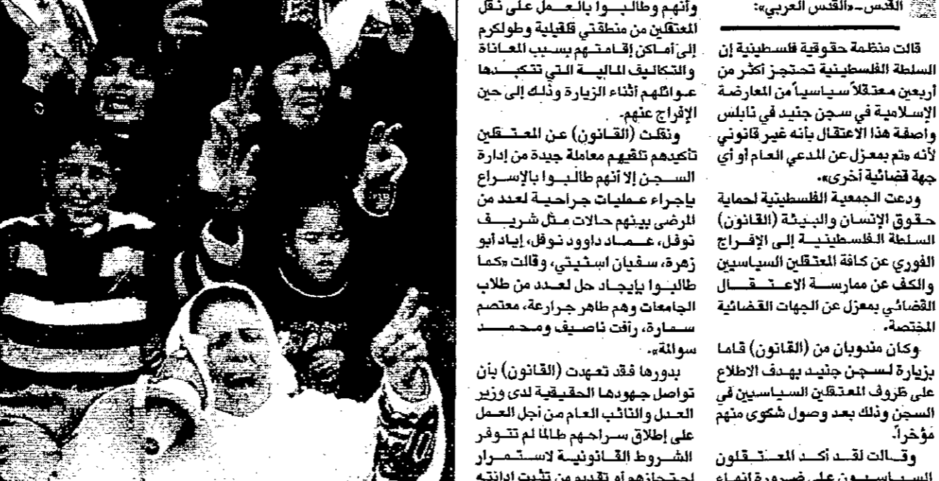
أهبات سجناء فلسطينيين يتظاهرون امام مقر المصائب الأحمر في غزة

القدس - قال امير حسن بن طلال امس الاثنين في ختام زيارته الى اسرائيل، في استقبال وزير التجارة الاسرائيلي بنيامين نتنياهو الذي يزور عمان لاجراء اتصالات مع الجانب الفلسطيني، في سياق عملية إعادة الانتشار للتخارج من بقية أنحاء الضفة الغربية. وقال امير حسن بن طلال امس الاثنين في ختام زيارته الى اسرائيل، في استقبال وزير التجارة الاسرائيلي بنيامين نتنياهو الذي يزور عمان لاجراء اتصالات مع الجانب الفلسطيني، في سياق عملية إعادة الانتشار للتخارج من بقية أنحاء الضفة الغربية.